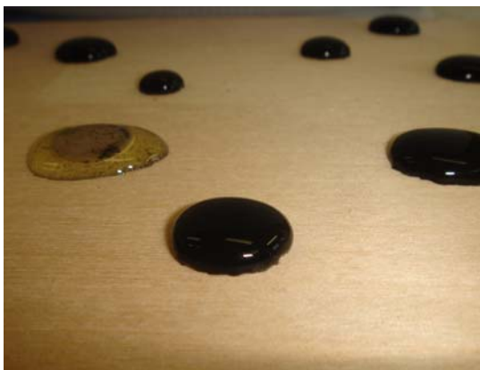
Öl- und fetthaltige Verschmutzungen auf einer imprägnierten Holzoberfläche